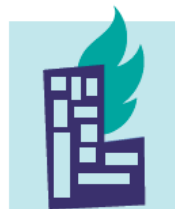
Incendios o explosiones