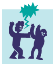
Situaciones de violencia

Relación de imágenes. Para niñas y niños pequeños se puede dibujar con ellos una patrulla, un camión de bomberos y una ambulancia y platicar sobre cómo puede responder cada uno de ellos en una emergencia del 9-1-1. Se pueden también dibujar escenarios en los que podría acudir cada uno de estos servicios.